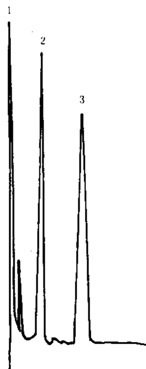
图3 乐果原药(加对苯二甲酸二正戊酯)的气相色谱图